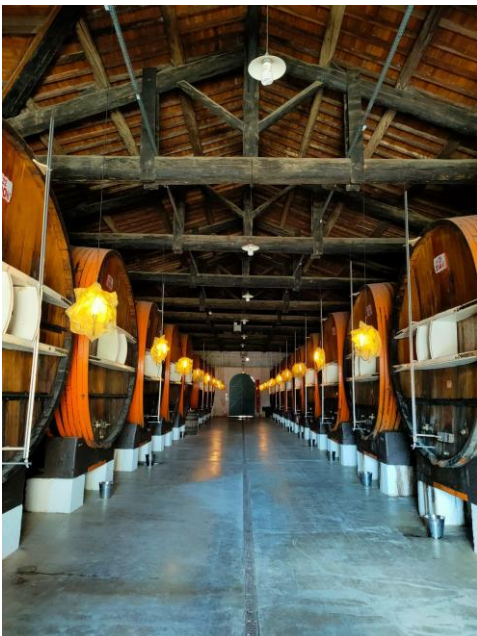
(Einblick bei Noilly Prat)

Mittwoch ging es nach Sète, eine Hafenstadt bekannt für ihren Markt. Dort haben wir eine Bootsfahrt gemacht und in einer Fromagerie mehr über Käse gelernt (natürlich mit Verkostung). Danach hatten wir Zeit, die Stadt und den Markt auf eigene Faust zu erkunden. Um 14.30 Uhr ging die Fahrt weiter zu Noilly Prat in Marseillan. Noilly Prat ist bekannt für seine Martinis, welche wir nach einer Führung verkosten durften. Bevor es in das Restaurant "Le Chateau Du Port" ging, haben wir noch eine Cocktailschulung bekommen. Um ca. 22.00 ging es zurück in die Auberge.