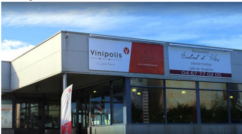
(Das Bistrot d'Alex)

Der Tag wurde, wie viele andere auch, mit einem Abendessen in der Auberge beendet.