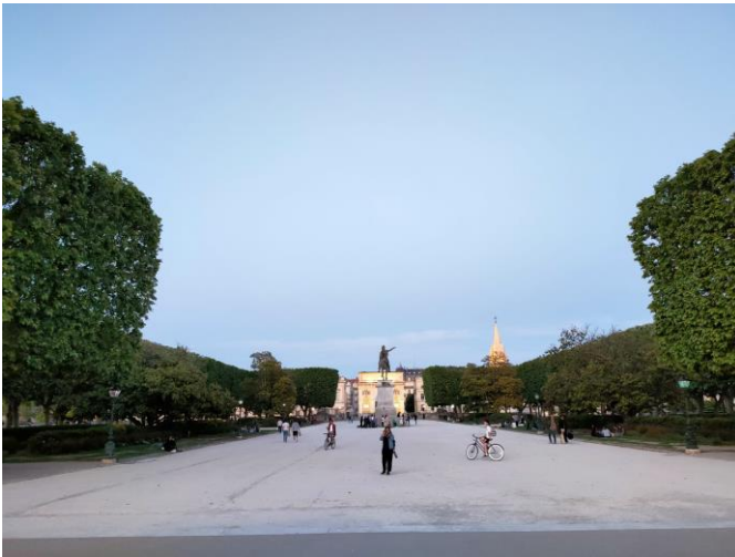
(Treffpunkt mit den französischen Schülern)

ein "lustiges" Foto in der Stadt machen musste. Zum Schluss konnten wir die Stadt selbständig erkunden.